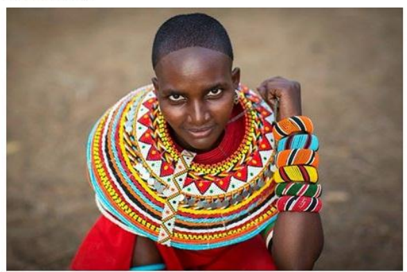
Eric Lafforgue ► MagicalKenya Rendille young woman in the remote area of Ngurunit, Kenya. She was newly married and had some wonderful beads necklaces. www.ericlafforgue.com

MagicalKenya shared Eric Lafforgue's photo. 14 hrs · #whyILoveKenya