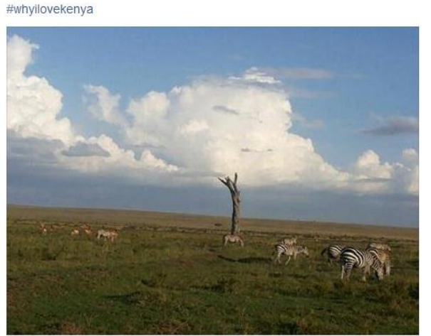
Welcome to Magical Kenya La bellezza avvincente del Masai Mara. Il solitario tronco sembra sorreggere le nuvole #magicalkenya #WhyILoveKenya

Serena Valle shared Welcome to Magical Kenya's photo. June 30 at 11:45am ·